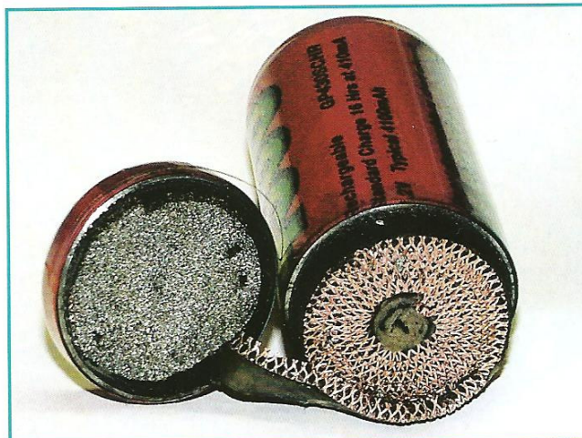
Die geöffnete Zelle.

Die Veränderungen der Schweißpunkte sind nach dem Öffnen der Zelle aber gut sichtbar. Nach dem Pushen ergab sich ein Innenwiderstand von ca. 1,4 \text{ m}\Omega . Die Zellen wurden dann noch einmal vermessen, um die beste