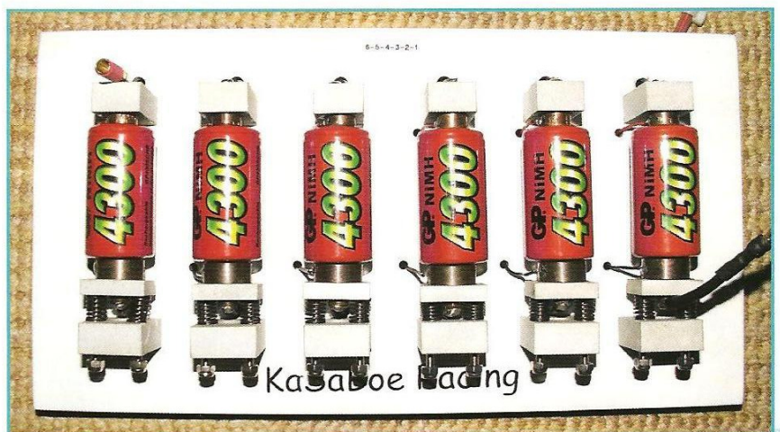
Die Zellen im Einzelzellenhalter bei der Messung.

bewerber hat die GP-Zelle an der Kathode ein Metall(Schwamm-)geflecht als Ableiter. Dieses ist am Becherboden einmal verschweißt. Das sogenannte „Drücken“ der Zellen bringt bei dieser Bauart also keine Vorteile mehr. Am Kopf